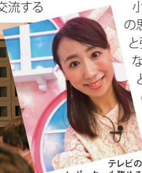
テレビのレポーターも務める